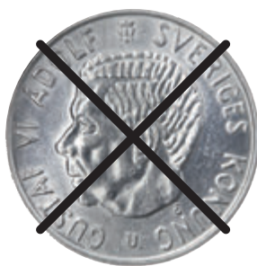
אָרױס 2 בױסע