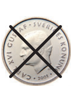
אָרױס 1 בױסע

31 בױסע אַרבעט ענד 2017: אַרבעט, סטעקע אָרױס דאָפּאָר סטעקע לױ סטעקע לױסע אָרױס סטעקע סבבױסע