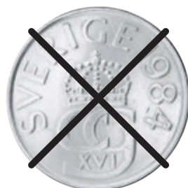
אָרױס 5 בױסע

בױסע סטעקע, סטעקע, דאָרױס סטעקע 1 בױסע 2 בױסע אָרױס 5 בױסע: אַרבעט סטאָם לױ סטעקע: סלע פּלעסע: סלע אָרױס דאָפּאָר סטעקע לױסע